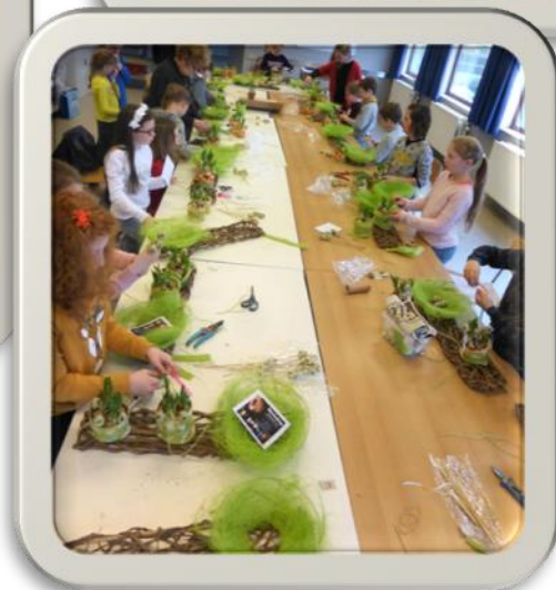
Paasworkshop voor kinderen