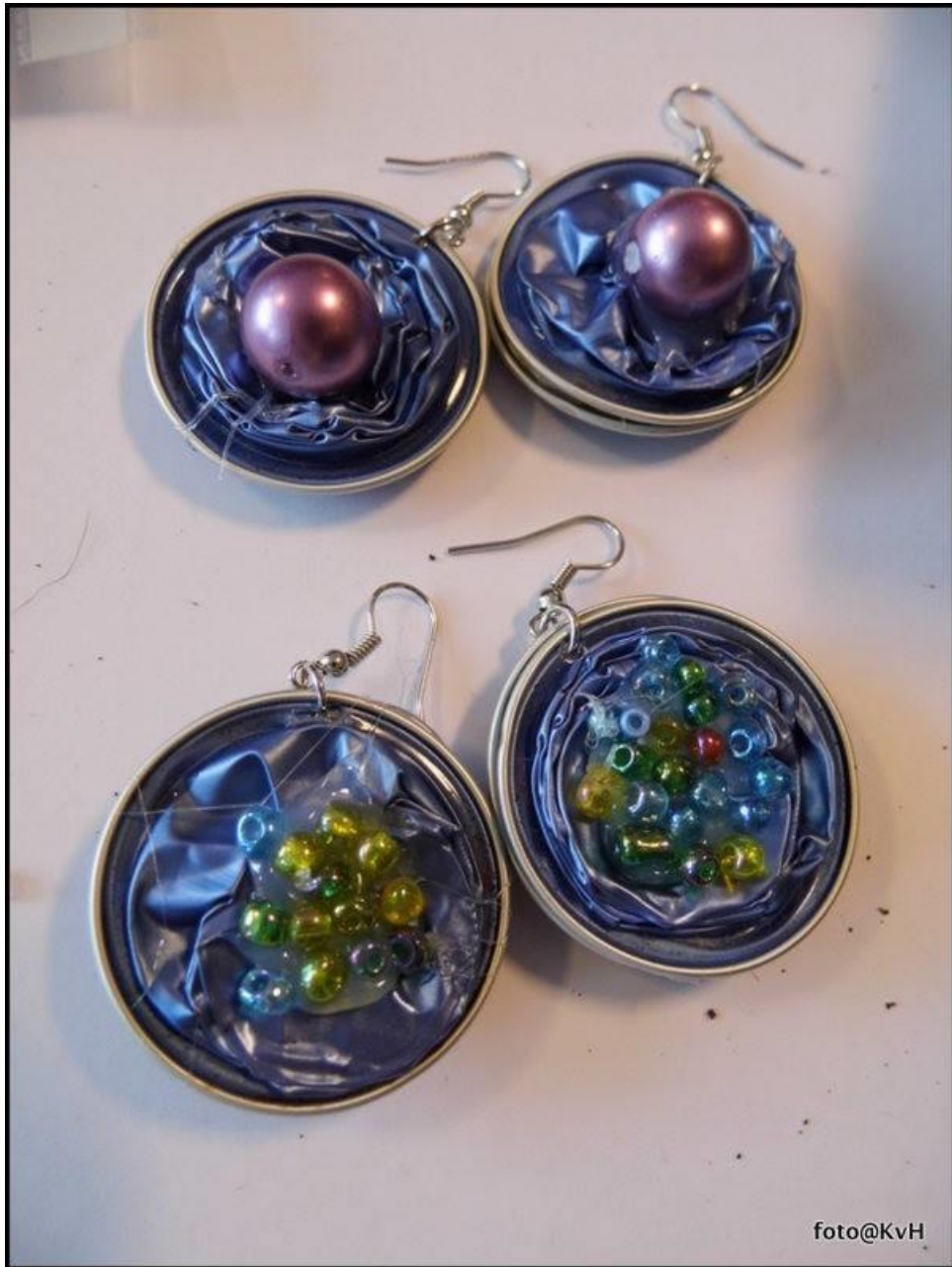
juwelen maken met koffiecups